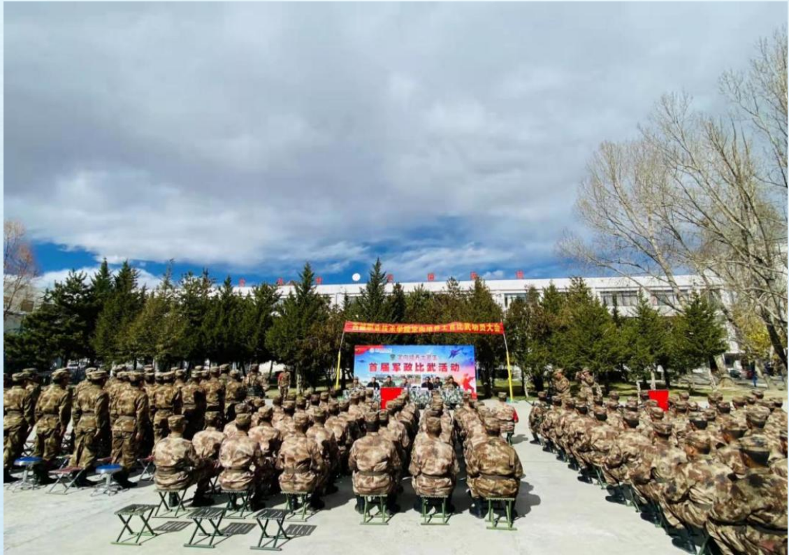
定向培养军士生首届军政比武