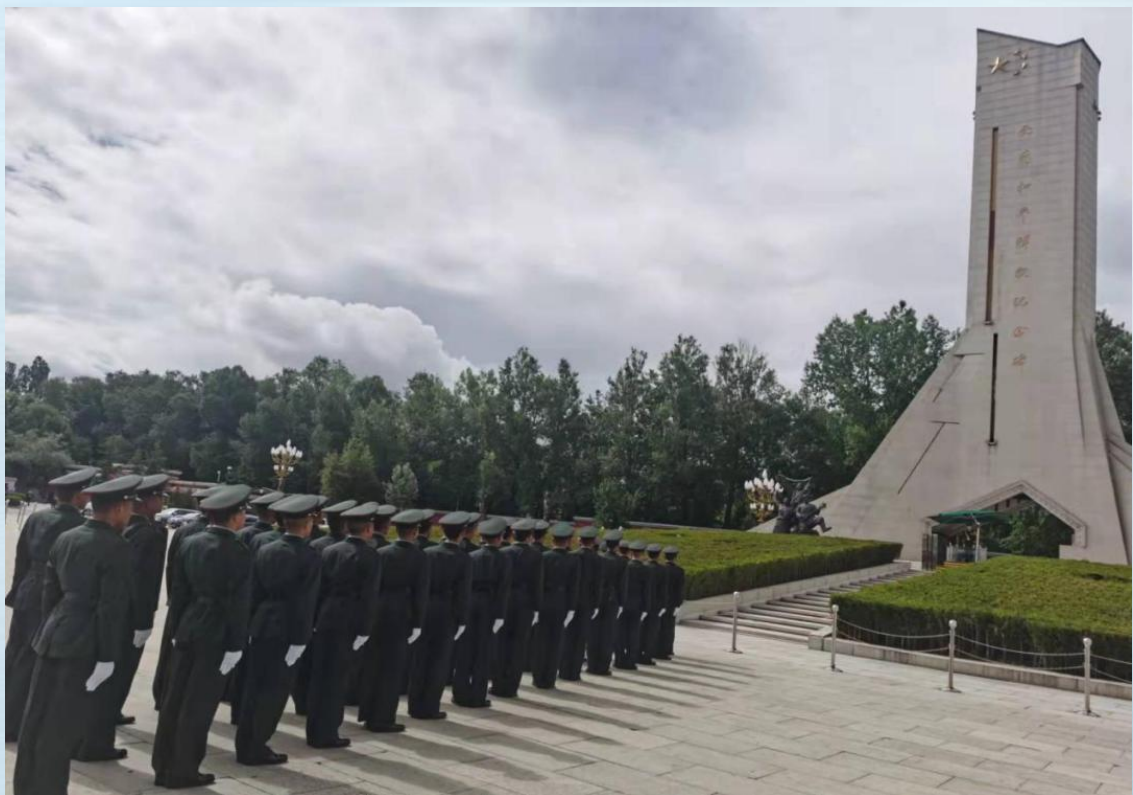
军士生班参观西藏和平解放纪念碑