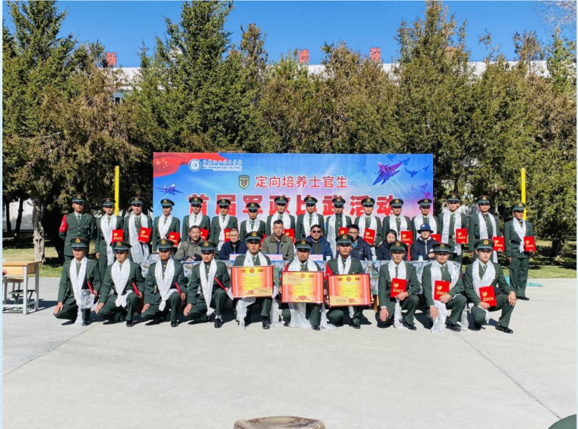
定向培养军士生首届军政比武圆满结束