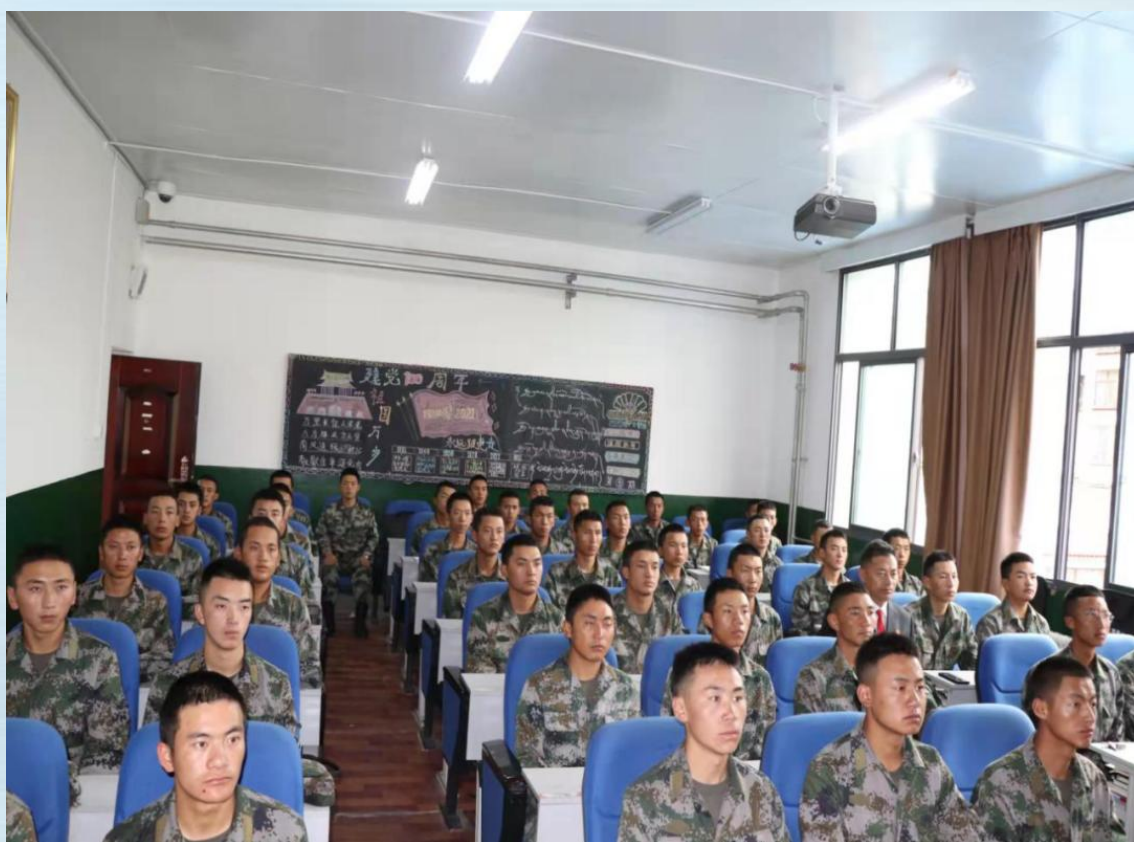
军士生学习专业课程