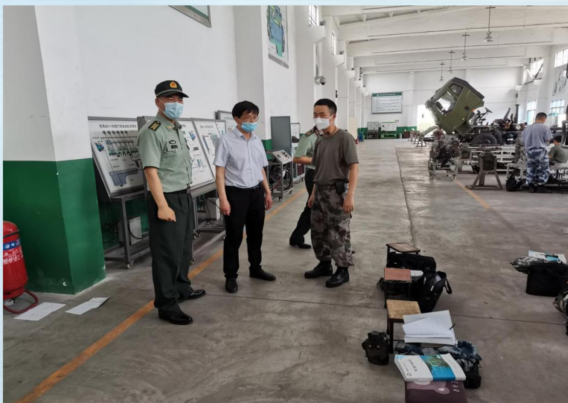
校领导考察调研军士班联合培养院校—— 陆军军事交通学院汽车军士学校